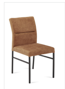
Stuhl Mod. Lyon 100 , Sitz/Lehne gepolstert, Füße Metall kantig schwarz