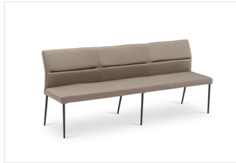
Bankteil Mod. Lyon 200 , Sitz/Lehne gepolstert, Füße Metall rund