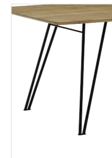
CAT19 Metallgestell pulverbeschichtet schwarz