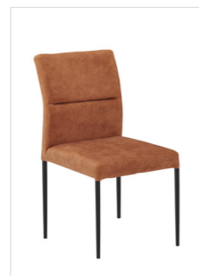
Stuhl Lyon 200 , Sitz/Lehne gepolstert, Füße Metall rund schwarz