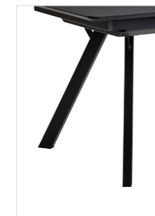
CAT26 Metallgestell pulverbeschichtet schwarz