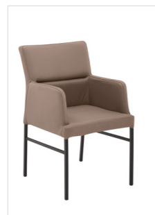
Stuhl Mod. Lyon 100A , Sitz/Lehne gepolstert, Füße Metall kantig schwarz