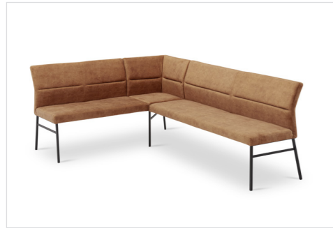
Eckbank Mod. Lyon 100 , Sitz/Lehne gepolstert, Füße Metall kantig