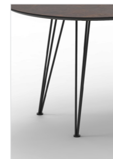
CAT13 Metallstäbe pulverbeschichtet schwarz