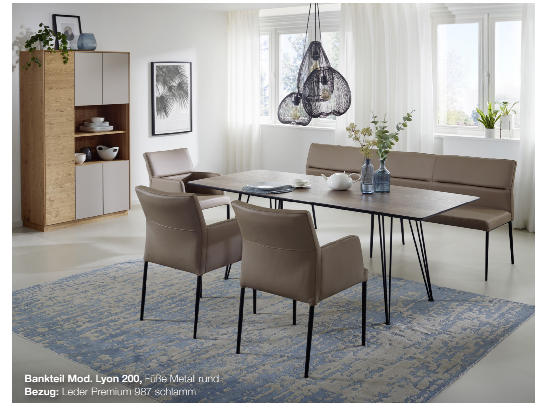
Bankteil Mod. Lyon 200, Füße Metall rund Bezug: Leder Premium 987 schlamm