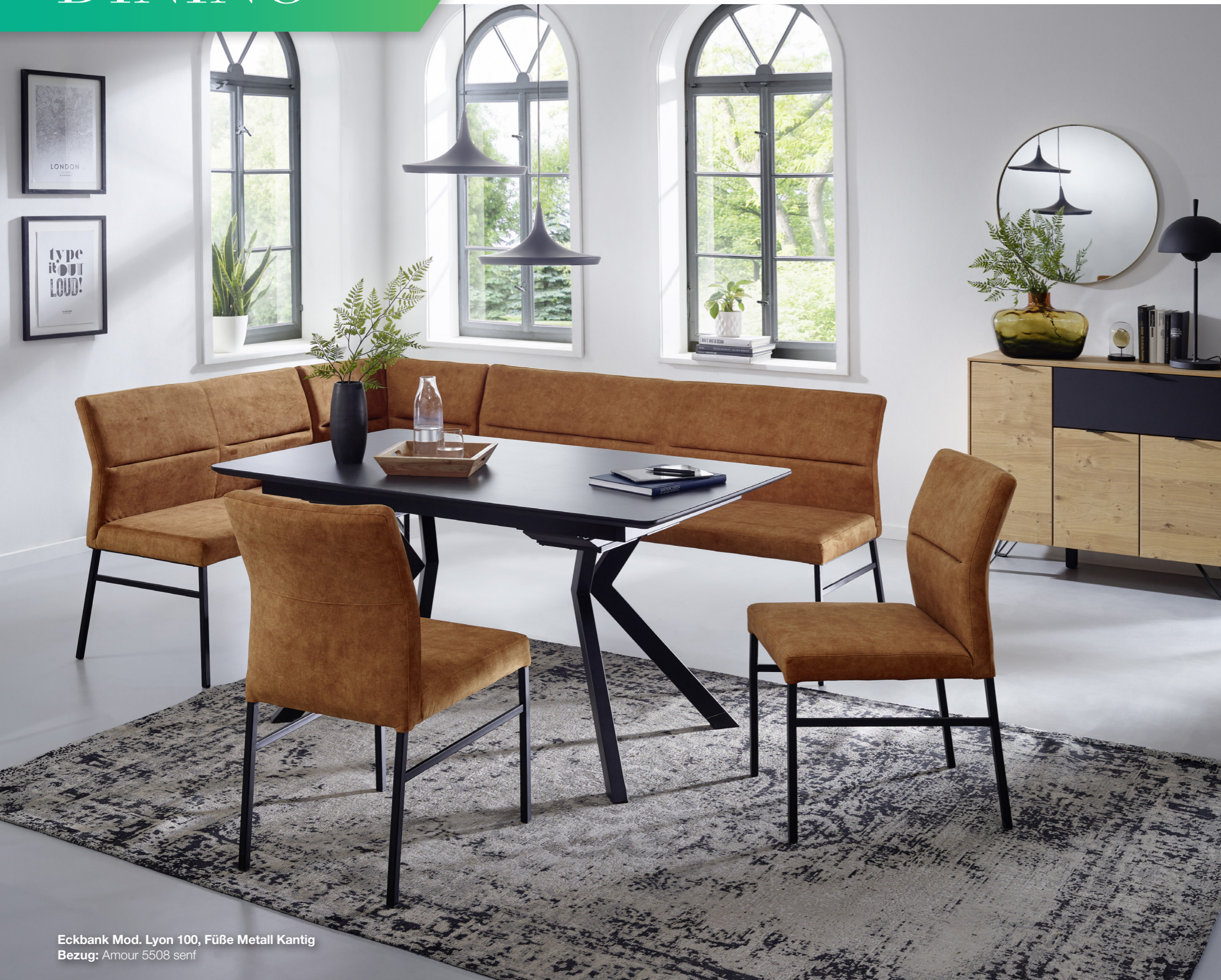
Eckbank Mod. Lyon 100, Füße Metall Kantig Bezug: Amour 5508 senf