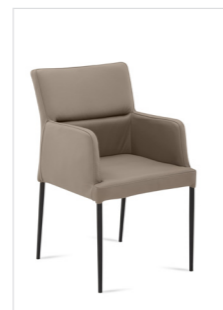
Stuhl Mod. Lyon 200A , Sitz/Lehne gepolstert, Füße Metall rund schwarz