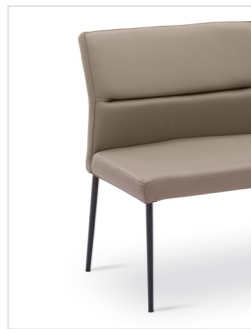
Lyon 200 Füße Metall rund