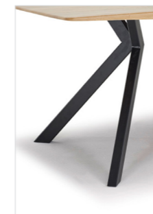
CAT12 Metallfüße pulverbeschichtet schwarz